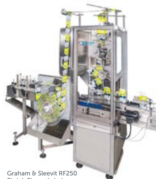
Graham & Sleevit RF250 Shrink Sleeve Labeler