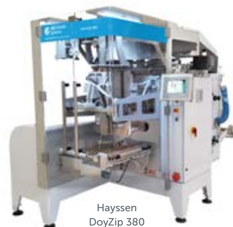
Hayssen DoyZip 380